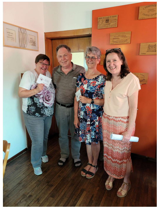
Die besten 3 bei Mannschaftsserie