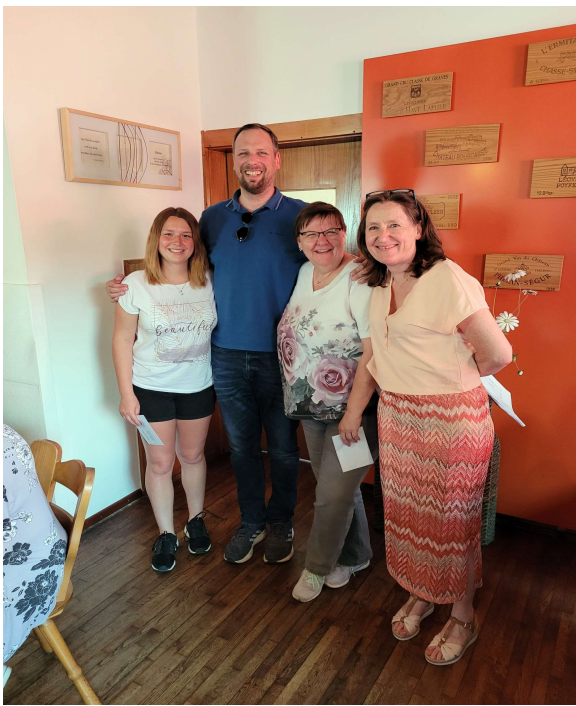
Die besten 3 bei Mannschaftsspiel